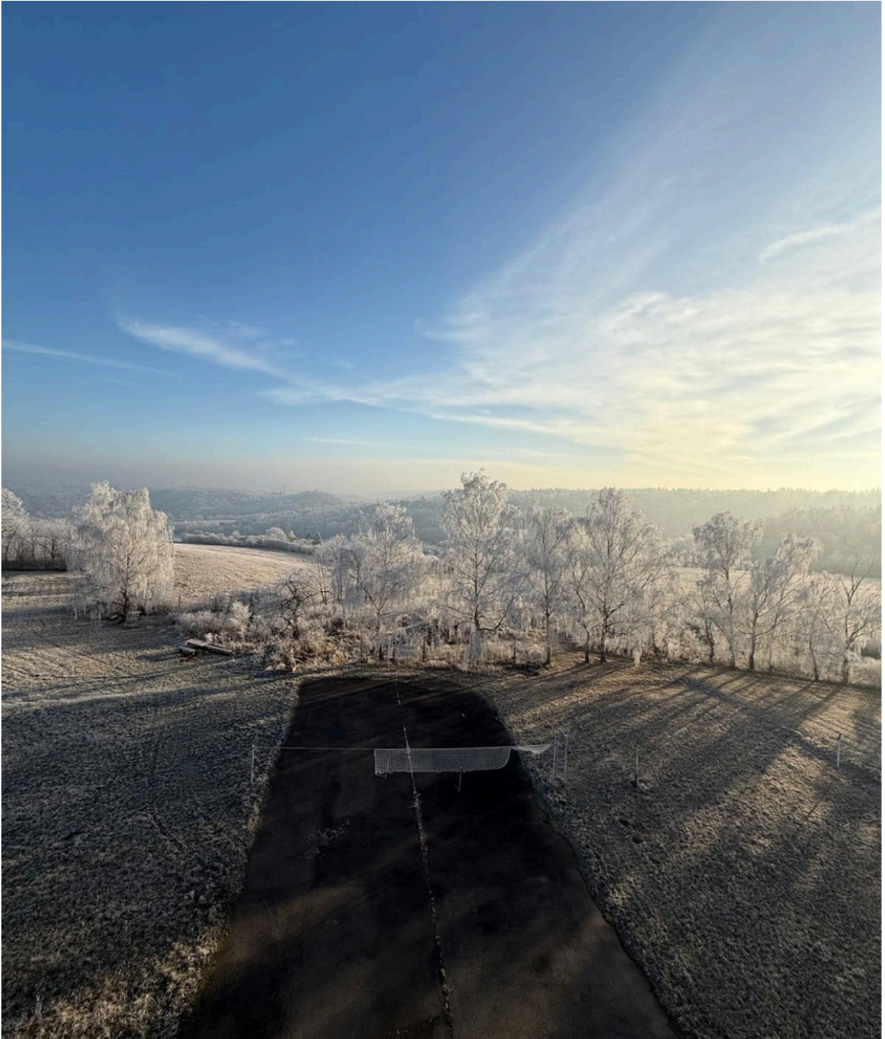
Colegio Mercedarias, País Vasco