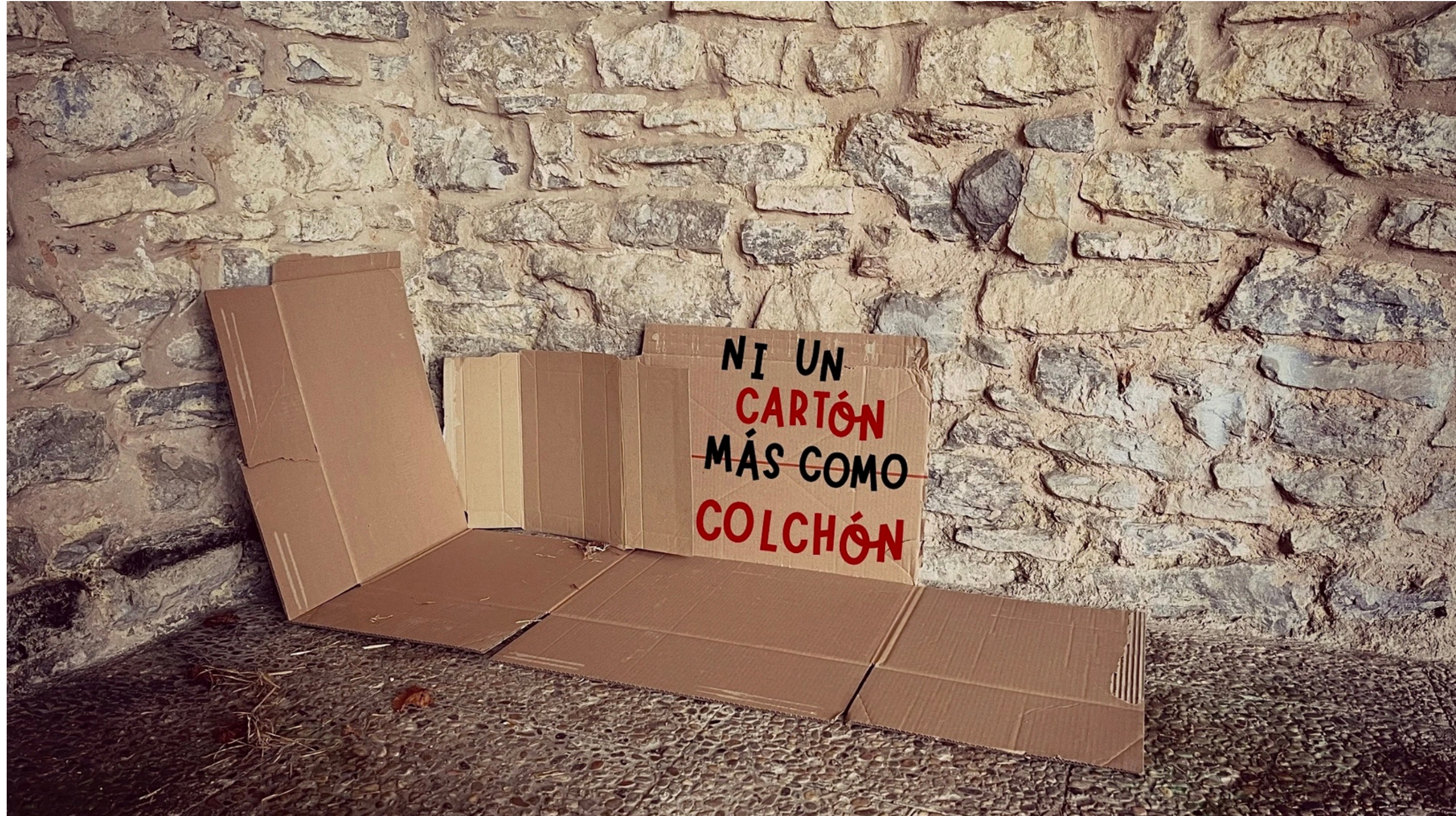
Colegio Nuestra Señora del Carmen, País Vasco