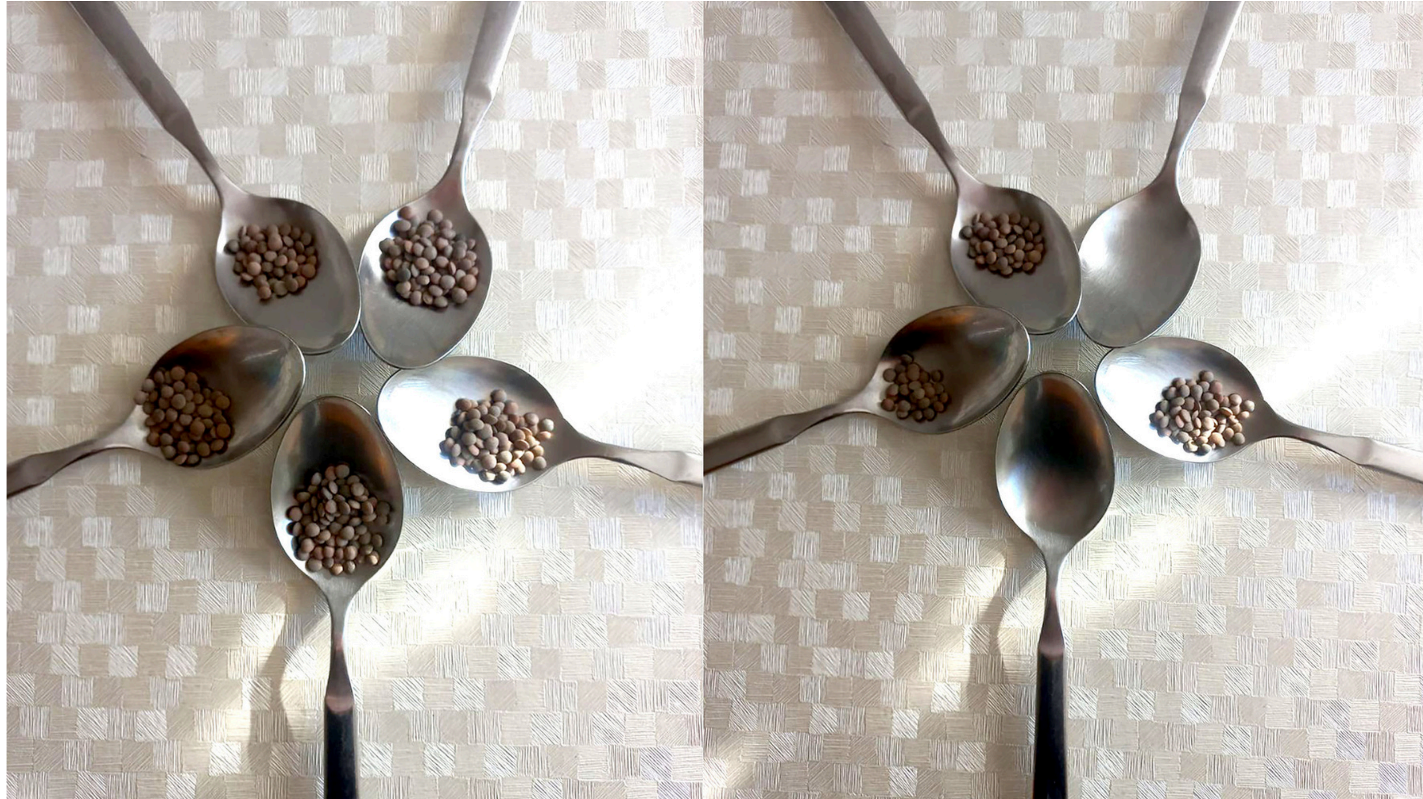
Colegio Santa María Marinistas, Comunidad Valenciana