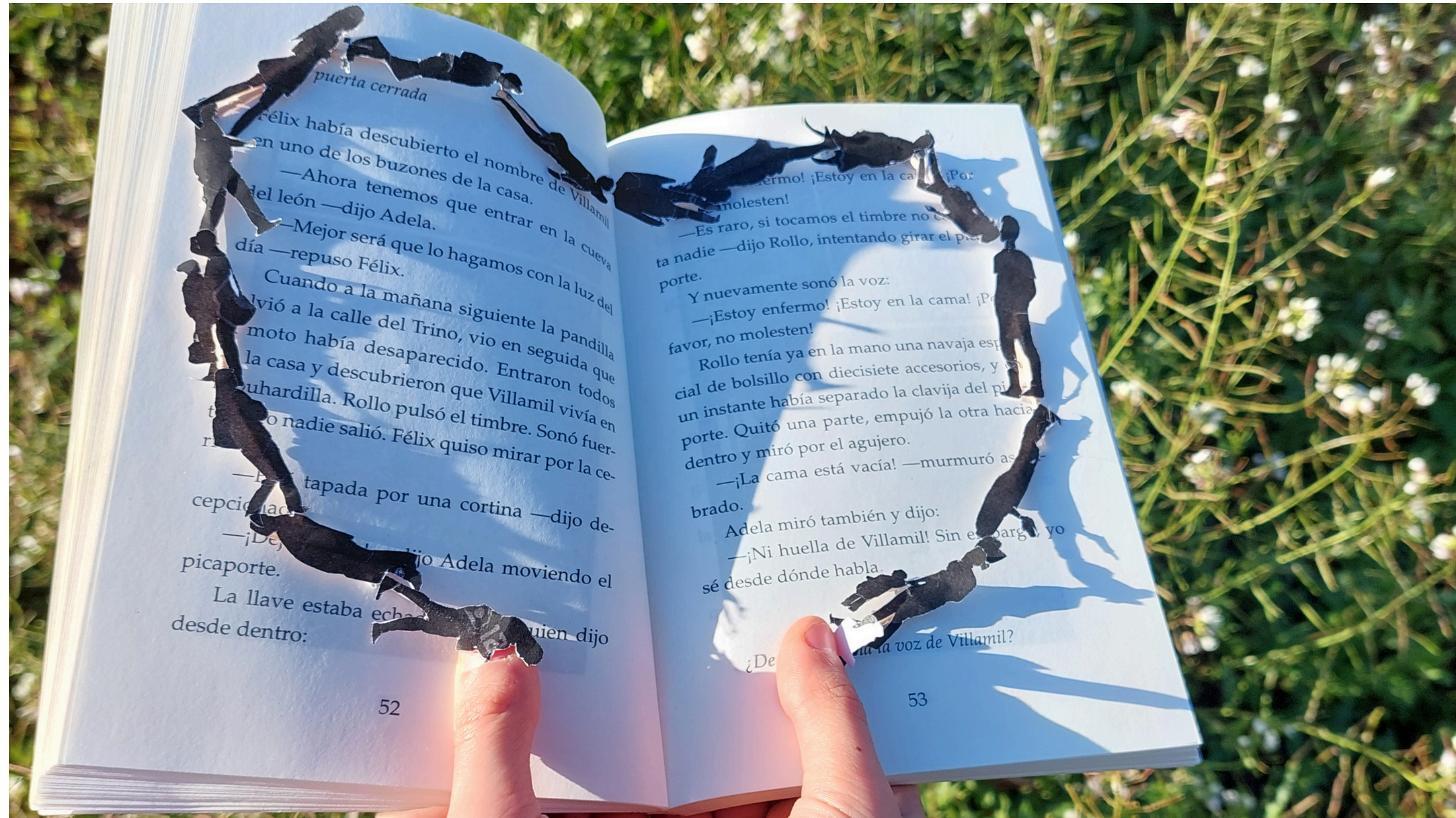
Colegio IES Gonzalo Anaya, Comunidad Valenciana