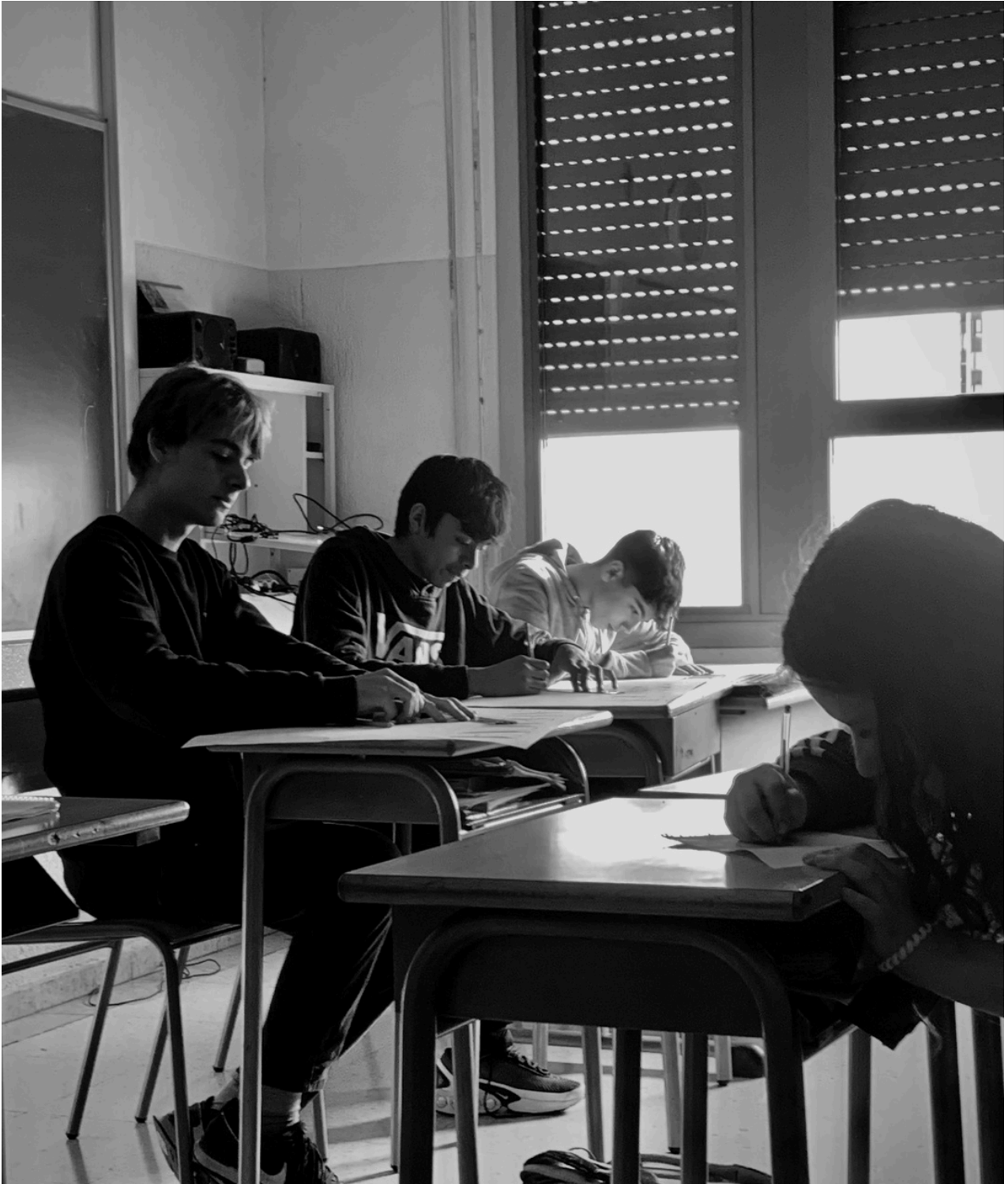
Colegio Claret Larraona, Navarra